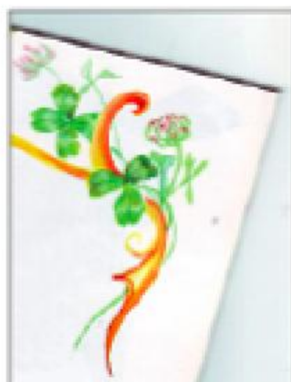
Nevenka Macolić: SLIKA U SPOMENARU