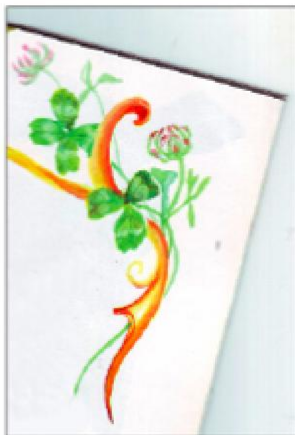
Nevenka Macolić: SLIKA U SPOMENARU